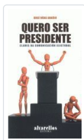
QUERO SER PRESIDENTE. CLAVES DA COMUNICACION ELECTORAL XOSE RUAS ARAUJO