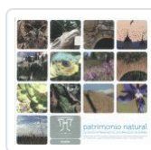
PATRIMONIO NATURAL. "INCLUE VERSION+DVD INTERACTIVO" VV.AA