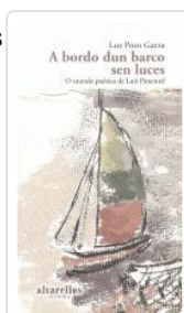
A BORDO DUN BARCO SEN LUCES LUZ POZO GARZA