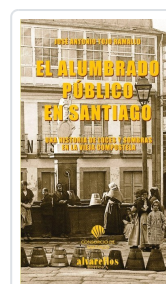
EL ALUMBRADO PUBLICO EN SANTIAGO JOSÉ ANTONIO TOJO RAMALLO