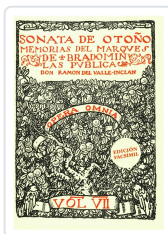
SONATA DE OTOÑO. MEMORIAS DEL MARQUES DE BRADOMIN RAMON DEL VALLE-INCLAN