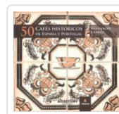
50 CAFES HISTORICOS DE ESPAÑA Y PORTUGAL FERNANDO FRANJO