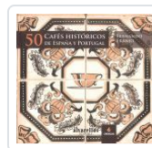
50 CAFES HISTÓRICOS DE ESPAÑA Y PORTUGAL FERNANDO FRANJO