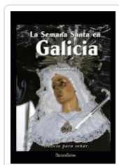
LA SEMANA SANTA EN GALICIA III. VV.AA.