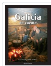
GALICIA DE CUENTO VV.AA.