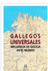
GALLEGOS UNIVERSALES VV.AA., ALFONSO EIRE (COORD.)