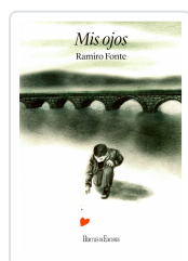
MIS OJOS RAMIRO FONTE