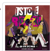
ISTO É ROCK! JAVIER BECERRA