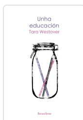
UNHA EDUCACION TARA WESTOVER