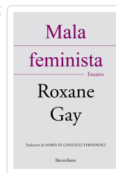
MALA FEMINISTA ROXANE GAY