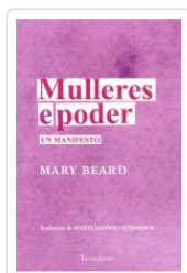
MULLERES E PODER MARY BEARD