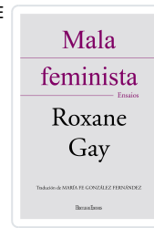
MALA FEMINISTA ROXANE GAY