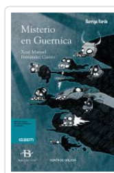
MISTERIO EN GUERNICA XOSE MANUEL FERNANDEZ CASTRO