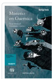
MISTERIO EN GUERNICA XOSE MANUEL FERNANDEZ CASTRO