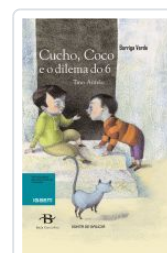
CUCHO, COCO E O DILEMA DO 6 TINO ANTELO