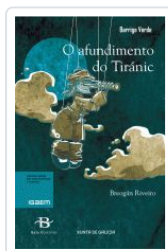
O AFUNDIMENTO DO TIRANIC BREOGAN RIVEIRO