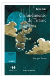
O AFUNDIMENTO DO TIRANIC BREOGAN RIVEIRO