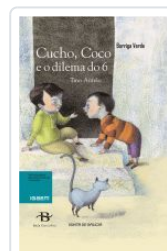
CUCHO, COCO E O DILEMA DO 6 TINO ANTELO