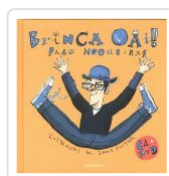
BRINCA VAI! (INCLUE CD-DVD) PACO NOGUEIRAS, DAVID PINTOR