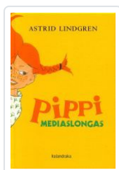
PIPII MEDIASLONGAS ASTRID LINDGREN