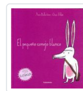
EL PEQUEÑO CONEJO BLANCO (19 EDICIÓN) XOSE BALLESTEROS;OSCAR VILLAN