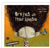
OREJAS DE MARIPOSA LUISA AGUILAR;ANDRE NEVES