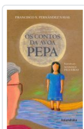
OS CONTO DA AVOA PEPA FRANCISCO FERNÁNDEZ;MANOLO FIGUEIRAS(ILU)