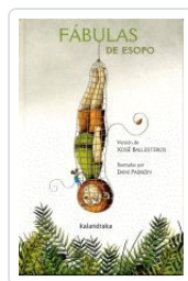
FABULAS DE ESOPHO XOSE BALLESTEROS;DANI PADRON