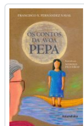
OS CONTOS DA AVOA PEPA FRANCISCO FERNANDEZ;MANOLO FIGUEIRAS(ILU)