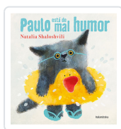
PAULO ESTÁ DE MAL HUMOR (Galego) NATALIA SHALOSHVILI