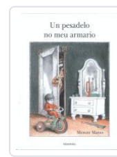
UN PESADEIRO NO MEU ARMARIO MAYER, MERCER