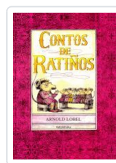
CONTOS DE RATÍÑOS ARNOLD LOBEL