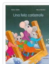
UNA FELIZ CATASTROFE ADELA TURIN;NELLA BOSNIA