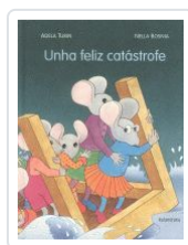
UNHA FELIZ CATASTROFE ADELA TURIN;NELLA BOSNIA