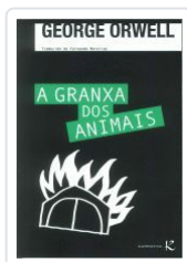
A GRANXA DOS ANIMAIS ORWELL, GEORGE