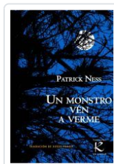
UN MONSTRO VEN A VERME PATRICK NESS