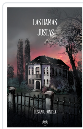
LAS DAMAS JUSTAS ROSANA FONCEA