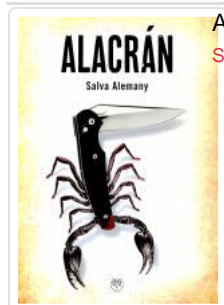
ALACRAN SALVA ALEMANY