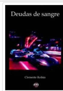
DEUDAS DE SANGRE CLEMENTE ROIBAS