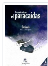
CUANDO ABRAS EL PARACAIDAS DEFREDS