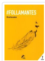
FOLLAMANTES CARLOS SALEM