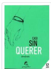
CASI SIN QUERER DEFREDS