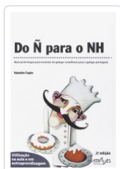
DO Ñ PARA O NH (2ªED) VALENTIM FAGIM