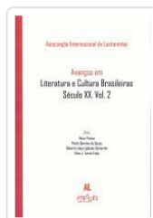
AVANÇOS EM LITERATURA E CULTURA BRASILEIRAS.SECULO XX.VOL.2 ASSOCIAÇÃO INTERNACIONAL DE LUSITANISTAS