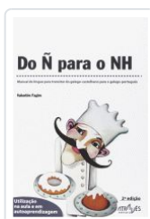
DO Ñ PARA O NH (2ªED) VALENTIM FAGIM