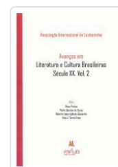
AVANÇOS EM LITERATURA E CULTURA BRASILEIRAS.SECULO XX.VOL.2 ASSOCIAÇÃO INTERNACIONAL DE LUSITANISTAS