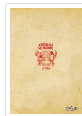
A REPUBLICA DAS PALAVRAS SECHU SENDE