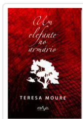
UN ELEFANTE NO ARMARIO TERESA MOURE