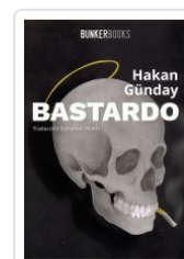
BASTARDO HAKAN GUNDAY