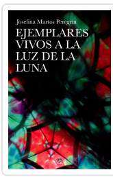
EJEMPLARES VIVOS A LA LUZ DE LA LUNA JOSEFINA MARTOS PEREGRIN