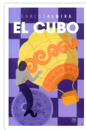
EL CUBO CARLOS ALMIRA