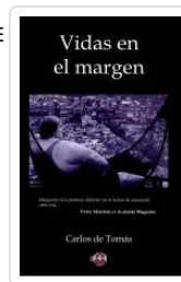
VIDAS EN EL MARGEN CARLOS DE TOMAS