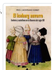
EL ICEBERG NAVARRO PEIO J. MONTEANO SORBET