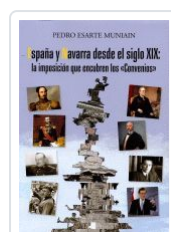
ESPAÑA Y NAVARRA DESDE EL SIGLO XIX: LA IMPOSICIÓN QUE ... PEDRO ESARTE MUNIAÍN