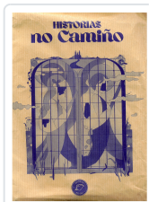
HISTORIAS NO CAMIÑO (BOLSA LIBRO+ AGASALLOS) AA.VV.