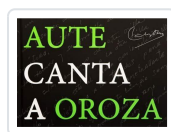
AUTE CANTA A OROZA . (LIBRO/CD) Carlos Oroza ; Luis Eduardo Aute