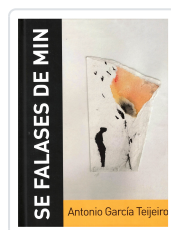
SE FALASES DE MIN (INCL.CD) ANTONIO GARCÍA TEJEIRO