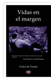
VIDAS EN EL MARGEN CARLOS DE TOMAS