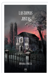
LAS DAMAS JUSTAS ROSANA FONCEA