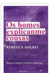
OS HOMES EXPLICANME COUSAS REBECCA SOLNIT