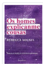
OS HOMES EXPLÍCANME COUSAS REBECCA SOLNIT