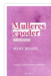
MULLERES E PODER MARY BEARD