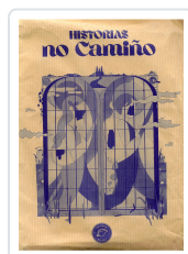
HISTORIAS NO CAMIÑO (BOLSA LIBRO+ AGASALLOS) AA.VV.