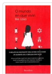
EL MUNDO EN QUE VIVÍ ILSE LOSA