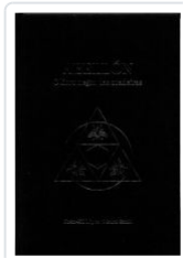
ABELLON. O LIBRO NEGRO DAS ZOADEIRAS XOAN-XIL LOPEZ;MAURO SANIN