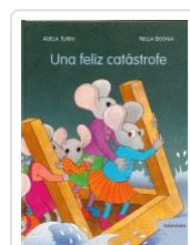
UNA FELIZ CATASTROFE ADELA TURIN;NELLA BOSNIA