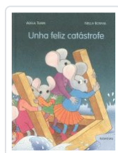
UNHA FELIZ CATASTROFE ADELA TURIN;NELLA BOSNIA