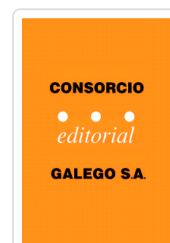
FREDERICK (CATALAN) LEO LIONNI