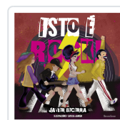
ISTO É ROCK! JAVIER BECERRA