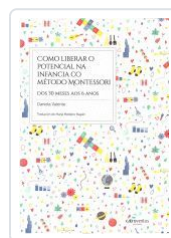
COMO LIBERAR O POTENCIAL NA INFANCIA CO METODO MONTESSORI DANIELA VALENTE