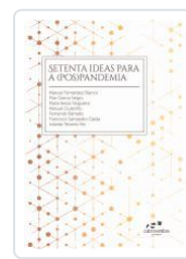
SETENTA IDEAS PARA A (POS)PANDEMIA AA.VV.