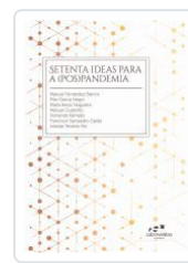
SETENTA IDEAS PARA A (POS)PANDEMIA AA.VV.