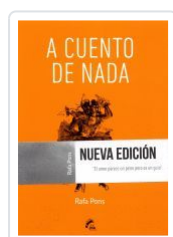
A CUENTO DE NADA RAFA PONS