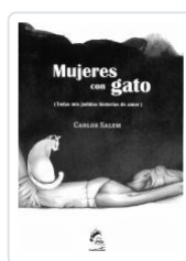
MUJERES CON GATO (TODAS MIS HISTORIAS DE AMOR) CARLOS SALEM