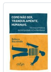
COMO NAO SER, TRANQUILAMENTE, HUMAN@S . TECNICA E POLITI REBECA BACEIREDO