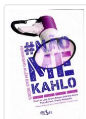
# NAO ME KAHLO.FEMINISMO ALEM DAS REDES VV.AA.