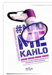
# NAO ME KAHLO.FEMINISMO ALEM DAS REDES VV.AA.