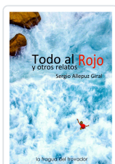
TODO AL ROJO Y OTROS RELATOS SERGIO ALLEPUZ GIRAL