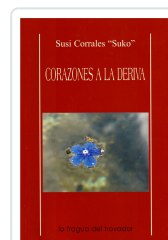
CORAZONES A LA DERIVA SUSI CORRALES "SUKO"