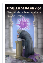
1598: LA PESTE EN VIGO ANTONIO GIRÁLDEZ