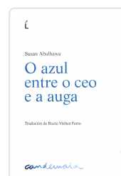
O AZUL ENTRE O CEO E AUGA SUSAN ABULHAWA