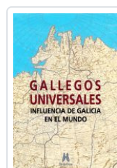
GALLEGOS UNIVERSALES VV.AA.: ALFONSO EIRE (COORD.)