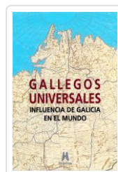
GALLEGOS UNIVERSALES VV.AA.: ALFONSO EIRE (COORD.)