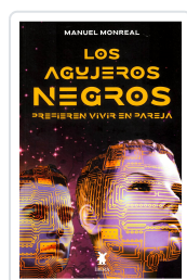
LOS AGUJEROS NEGROS PREFIEREN VIVIR EN PAREJA MANUEL MONREAL