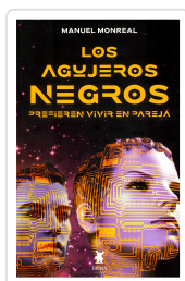
LOS AGUJEROS NEGROS PREFIEREN VIVIR EN PAREJA MANUEL MONREAL