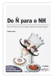
DO Ñ PARA O NH (2ªED) VALENTIM FAGIM