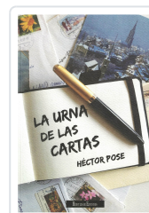
LA URNA DE LAS CARTAS HÉCTOR POSE PORTO