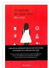
EL MUNDO EN QUE VIVI ILSE LOSA