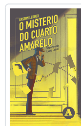
O MISTERIO DO CUARTO AMARELO LEROUX, GASTON