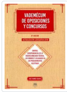
VADEMECUM DE OPOSICIONES Y CONCURSOS JOSE RAMON CHAVES